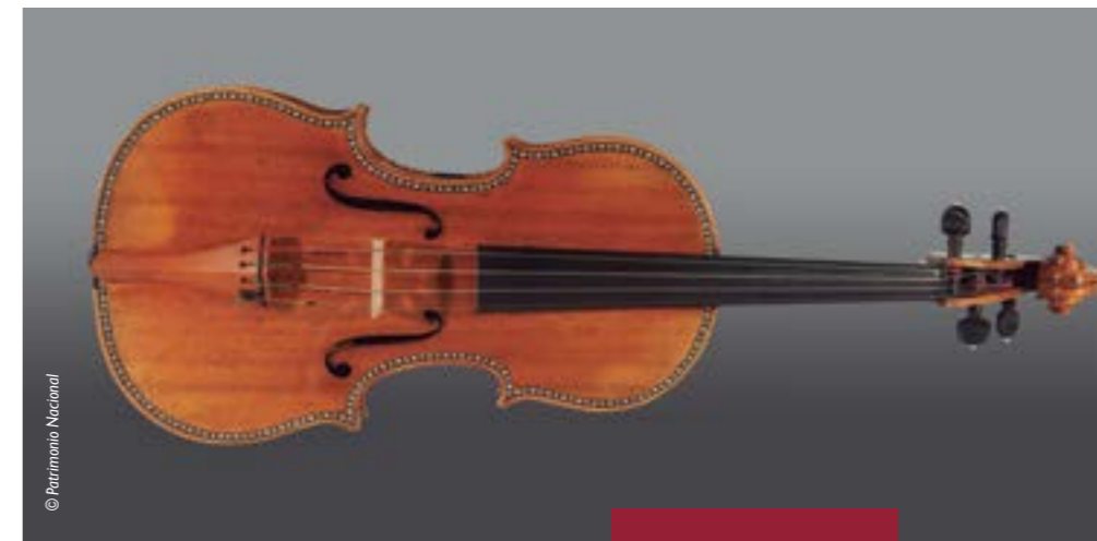
Viola colección palatina.