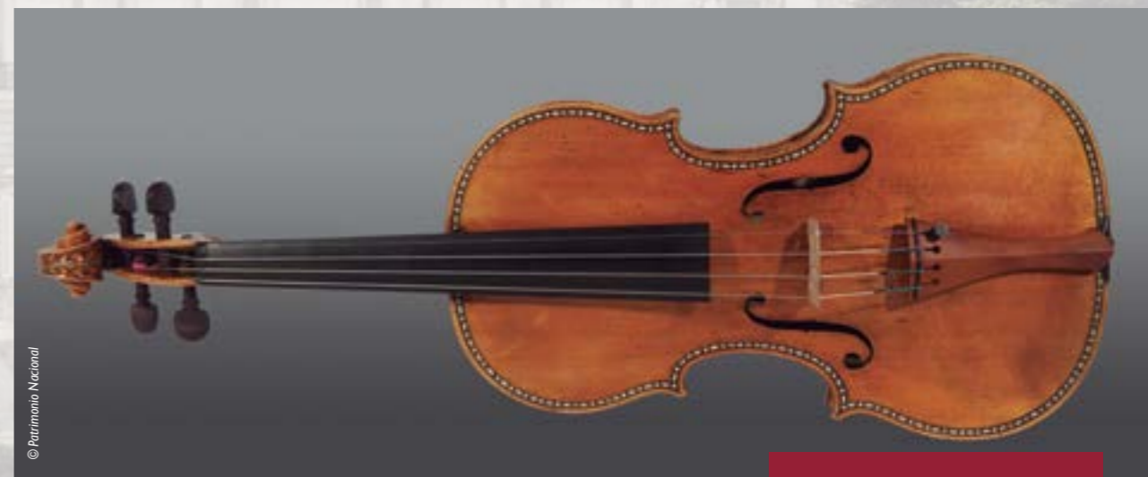
Primer violín de la colección palatina.

A lo largo de su carrera profesional, Antonio Stradivari fabricó más de mil instrumentos de cuerda, de los cuales han sobrevivido en perfectas condiciones alrededor de seiscientos cincuenta. El propio constructor decoró algunos de ellos con mimo y delica-